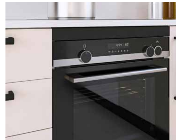
En mueble de horno

La versión VISTO de Rincomatic_Ventoo, ubicado a línea de frente, combina con los tiradores y electrodomésticos gracias a la variedad de acabados disponible. Además, refuerza los encastres y dimensiona el mueble, dejando el espacio necesario para una buena ventilación de la inducción.