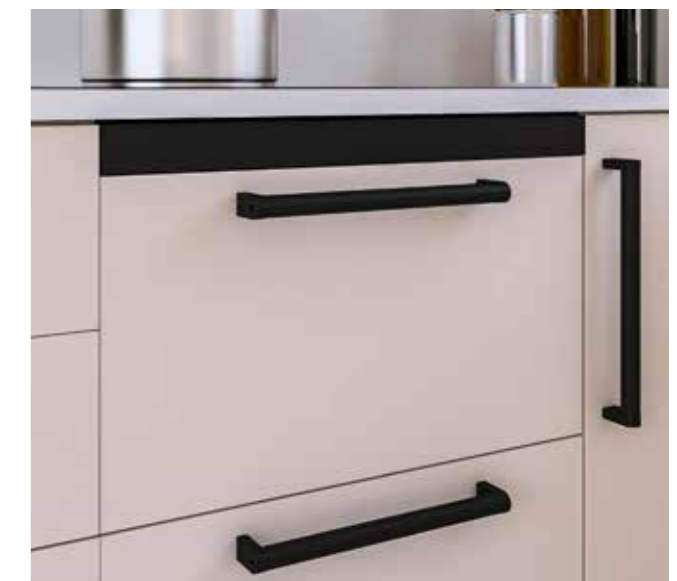
En mueble de cajones o puertas