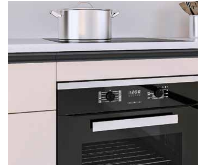
En mueble de horno con frente fijo