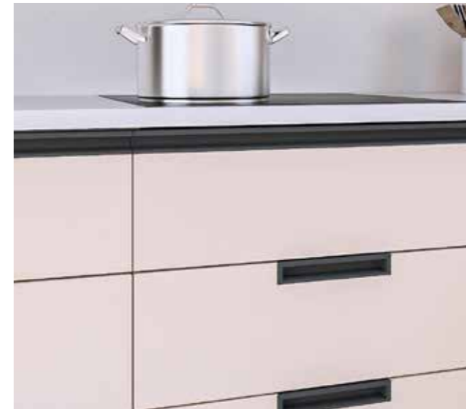
En mueble de cajones o puertas

La versión OCULTO de Rincomatic_Ventoo proporciona una estética uniforme al resto de los amueblamientos, permaneciendo invisible. Además, refuerza los encastres y dimensiona el mueble, dejando el espacio necesario para una buena ventilación de la inducción.